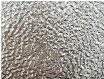
Stucco embossed aluminum sheet

Las bobinas de aluminio gofrado generalmente se fabrican a partir de bobinas anchas de aluminio, que son productos laminados planos producidos por laminadores en frío y en caliente. Cuando la bobina ancha pasa a través de la máquina laminadora de placas con rodillos estampados, los patrones de los rodillos se presionan contra la superficie de la bobina bajo presión. Se utiliza mucho como aislante y en ocasiones como decoración. Las aleaciones que utilizamos comúnmente son las series 1xxx, 3xxx y 5xxx.