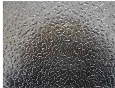
Stucco embossed aluminum sheet